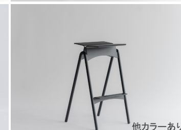
カモメバースツール 他カラーあり 80,900円