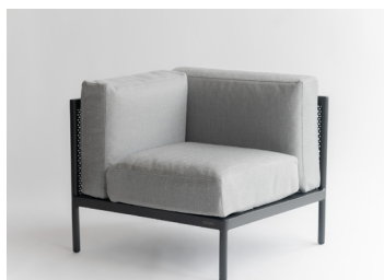
コーナースファ 268,200円