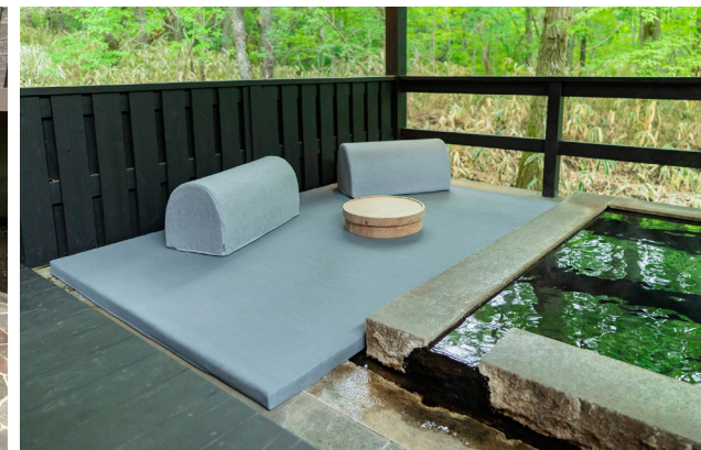
大分リゾートホテル 露天風呂