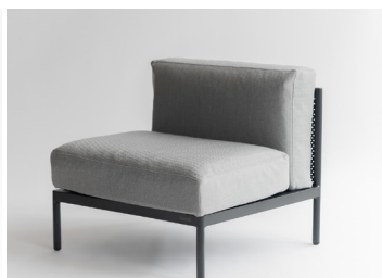
アームレスソファ 222,800円