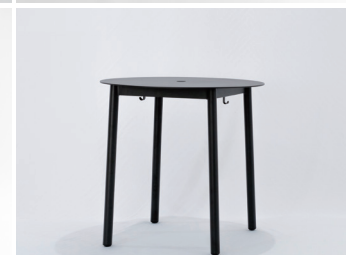
ハイルラウンドバーテーブル 118,200円