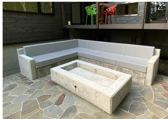
長野 軽井沢 個人邸