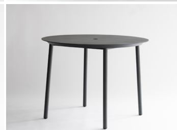
ラウンドダイニングテーブル 150,000円