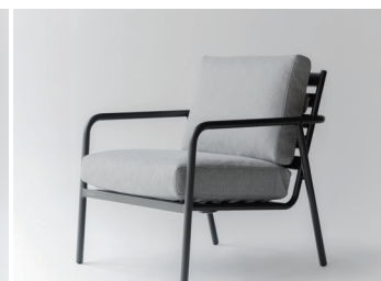
ラウンジチェア 162,800円