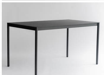
ダイニングテーブル 159,100円～