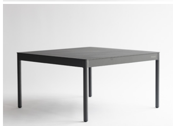
サイドテーブル75 104,600円