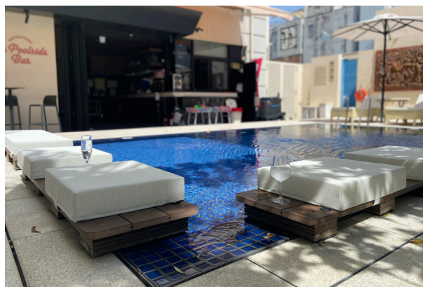
沖縄リゾートホテル

屋外の厳しい環境下においても長く快適に、そして清潔にお使いいただけるライトウェーブは、ホテル、グランピング、旅館、個人邸など多くの事例があります。 物件に合わせたオリジナルのクッションをオーダーできますのでお気軽にお問い合わせください。