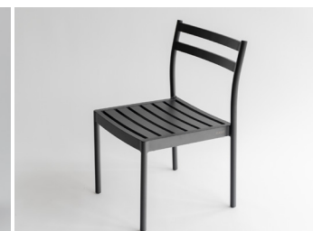
アームレスチェア 56,400円