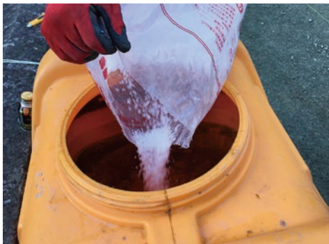
塩化マグネシウム(商品名:サニーキーパー)