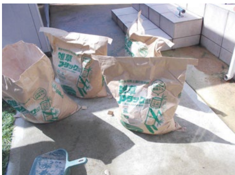
補修用雑草アタックα